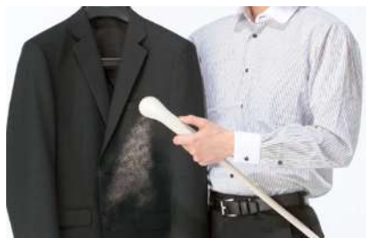
温水シャワーでイージーケア

最高の湿度コントロール能力を持つウール素材を利用し、温水シャワーのみで簡単に汗や汚れを洗い流せ、そのままノーアイロンで気持ちよくお召しいただけるコナカ独自の技術です。シャワークリーンスーツは、素材にこだわり簡単お手入れを実現させた、高湿度で不快な日本の夏に最適な、コナカを代表するスーツです。