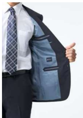
裏地にファイテンのアクアチタン技術を施しました