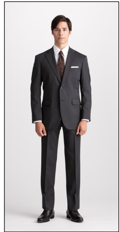
乾燥後はノーアイロンで着用